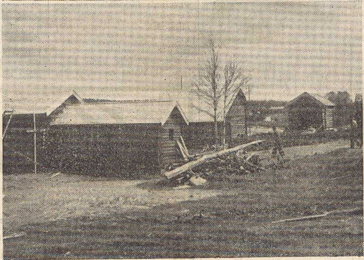
Upptill gammelgårdens stuga och därunder utsikt över gården från gammelkyrkan.